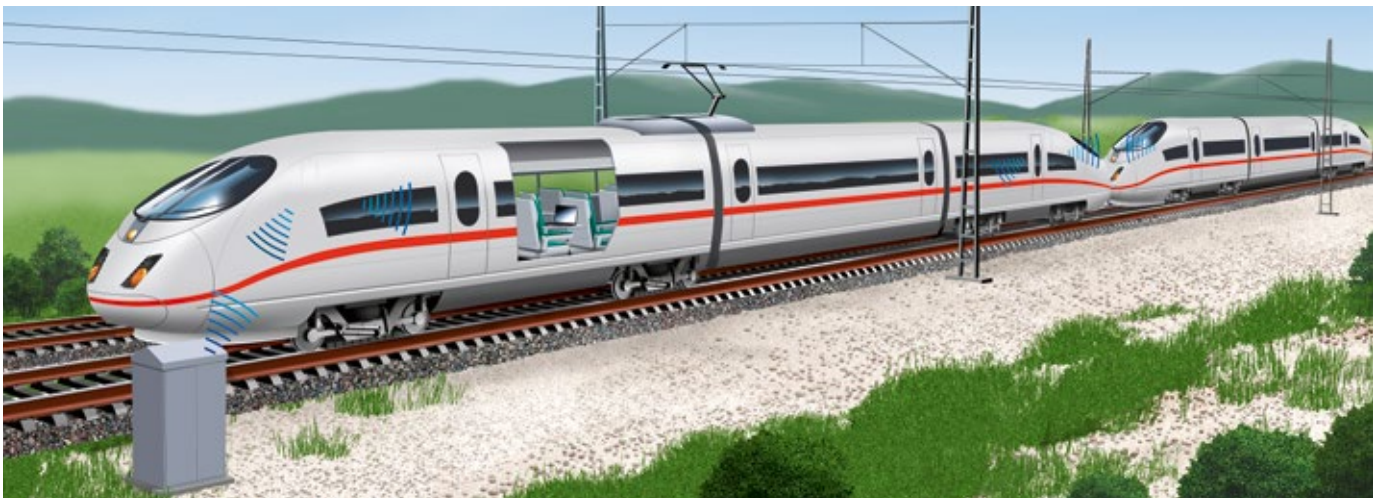
Das neue BE43802 ist eine Schlüsselkomponente der Belden Cat 7-Railway-Gesamtlösung

Die hochflexiblen, fein-drähtigen Litzenleiter sorgen für erhöhte Lebensdauer; gleichzeitig garantiert der einzigartige Kabelaufbau Sicherheit und Komfort für die Passagiere.